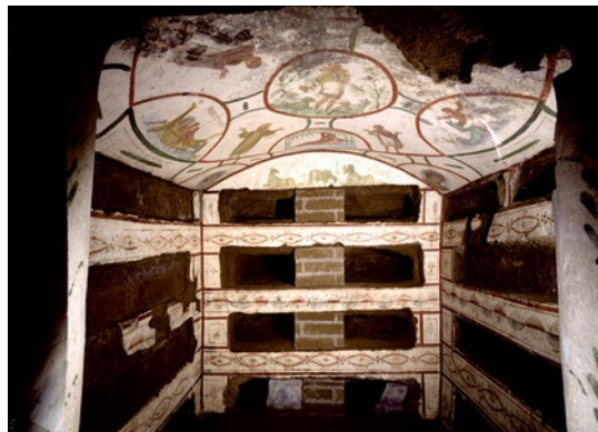
Salle de catacombes décorée de fresques datant du IIIe s. - Rome