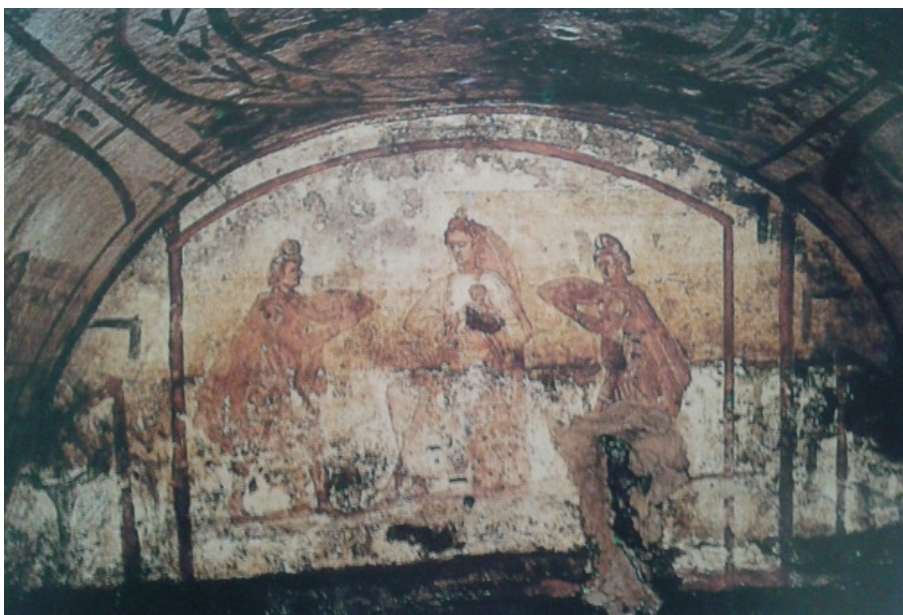
La vierge et les mages - Catacombes des Saints Marcellin et Pierre – Rome